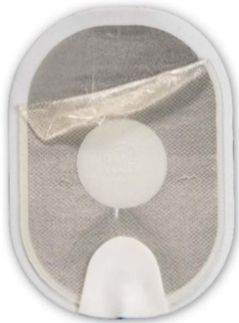
Abbildung 1: Abgelöstes Gel, das sich beim Abziehen übereinander gefaltet hat.

Es ist auch möglich, dass sich das Gel beim Abziehen fast vollständig von der Schaumstoff-/Metallfolie ablöst (siehe Abbildung 3 .) Aufgrund der kleinen Gel-Kontaktfläche mit der Haut könnte es bei Abgabe eines Schocks zu einer Lichtbogenbildung kommen, die zu Verbrennungen auf der Haut des Patienten führt, oder der AED könnte nicht mehr in der Lage sein, über die Pads einen Schock abzugeben. Die Therapie verzögert sich, während der Anwender eine Ersatz-Pads-Kassette (falls verfügbar) einlegt oder eine HLW durchführt, während er auf das Eintreffen des Rettungsdienstes wartet. Zum Vergleich wird in Abbildung 4 ein normales Pad gezeigt. Befolgen Sie unabhängig vom Zustand des Pads die Sprachanweisungen, da der AED Sie Schritt für Schritt durch die notwendigen Maßnahmen führt.