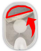
Bereiche mit fehlendem Gel

Bei einigen mit dem HS1/OnSite/Home AED verwendeten Elektrodenpads wurde beobachtet, dass sich Gel von der Schaumstoff-/Metallfolie ablösen kann, wenn die Pads von der gelben Kunststoffkarte abgezogen werden. Das Gel kann sich übereinander falten, was zu einer Verkleinerung der Gelfläche auf dem Pad führt. Aufgrund der verkleinerten Kontaktfläche mit der Haut könnte ein Pad in diesem Zustand dazu führen, dass der HS1/OnSite/Home eine weniger wirksame oder unwirksame Therapie am Patienten durchführt.