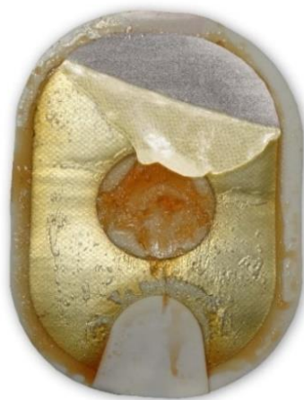
Figura 2: il gel ripiegato e separato può apparire scolorito e/o disciolto.

Azione: applicare gli elettrodi al paziente. Non esitare.