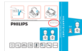
M5072A confezione in alluminio