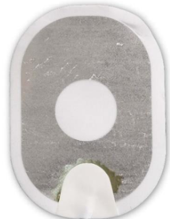
Figura 3: gel quasi completamente separato dal supporto.

Azione: applicare gli elettrodi al paziente. Non esitare.