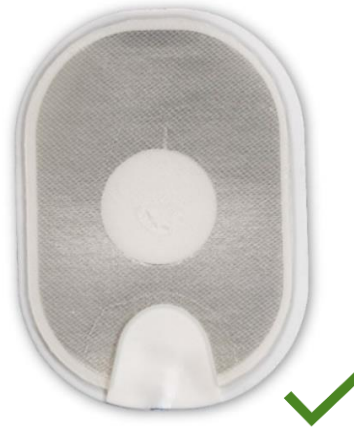
Figura 4: elettrodo normale